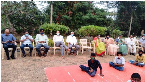
Rotarians, Anns & Guests on the occasion