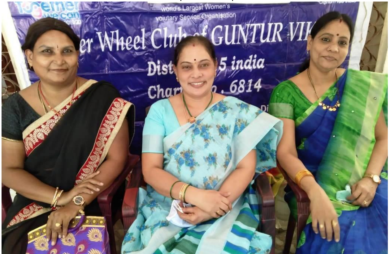
Inner Wheel Club Members, who attended the Service Project on 08.12.2020 at Old Age Home, Kalyani Road, Guntur