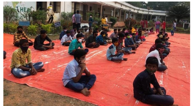
HEAL Children's Village Inmates.